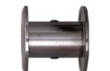
Kellerverbinder Typ A/M