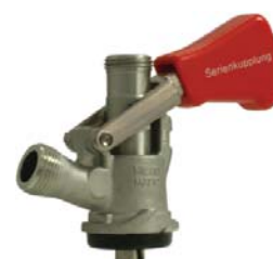
Zapfkopf Typ S (Korb), Serienkupplung