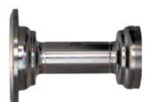
Kellerverbinder Typ A / M / S