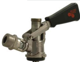
Zapfkopf Typ S (Korb)