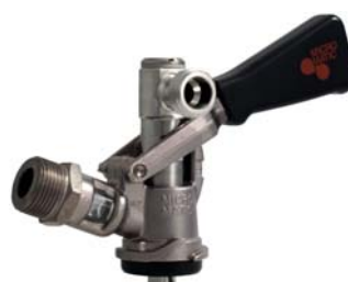
Zapfkopf Typ S (Korb), mit seitlichem Anschluss