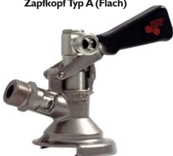
Zapfkopf Typ A (Flach), mit seitlichem Anschluss