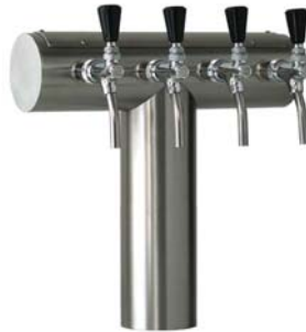
Zapfsäule »Mr.T«, 4-leitig