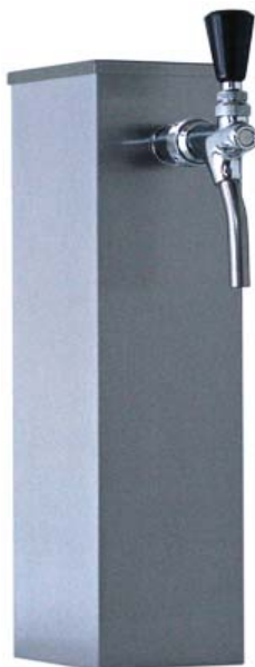
Zapfsäule »BERLIN«, Edelstahl matt, 1-leitig