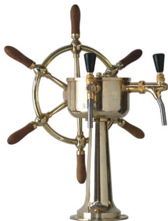
Zapfsäule „Steuerstand“, 2-leitig