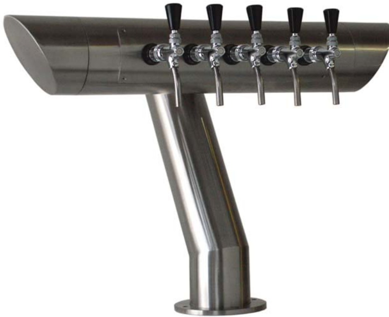
Zapfsäule »Mr.7«, Sonderbau, Edelstahl matt gebürstet, 5-leitig