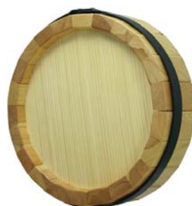
Fassboden, Holz mit lackiertem Stahlring