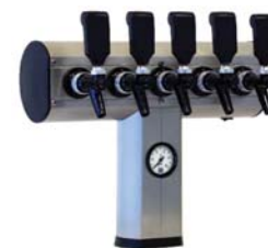
Zapfsäule »HERTEN«, Edelstahl matt, 5-leitig