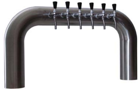
Zapfsäule »Mr.U«, 6-leitig