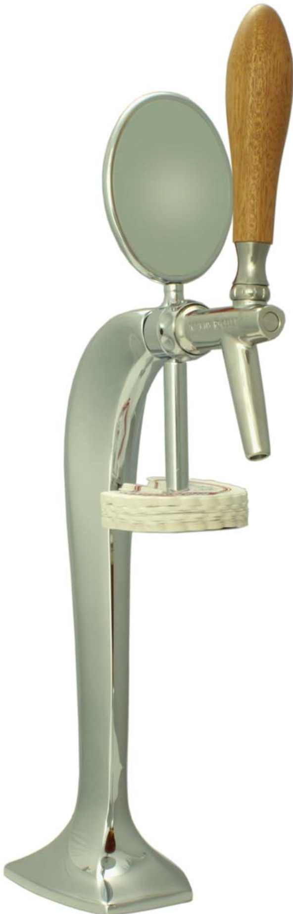
Zapfsäule »COBRA«, verchromt, 1-leitig mit Kompensator-Zapfhahn FC4 INOX, Werbeträger, Zapfhahngriff »Woddy« und Tropfdeckchenhalter (Lieferung ohne Zubehör Deko)