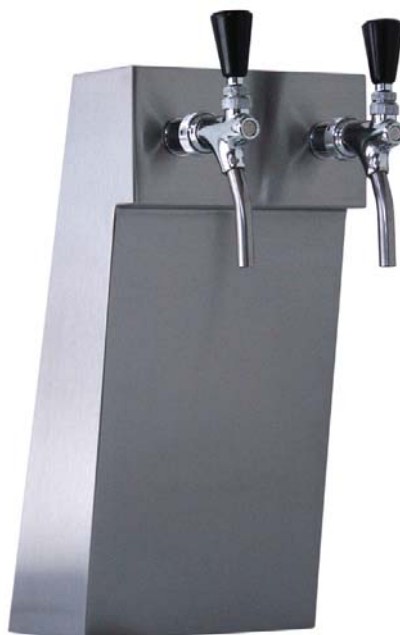
Zapfsäule »WIEN«, Edelstahl matt, 2-leitig