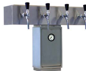
Zapfsäule »BONN«, Edelstahl matt, 4-leitig