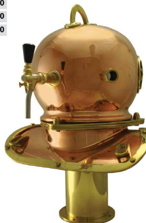
Zapfsäule „Neavyhead“, 1-leitig