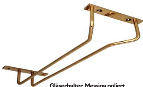
Gläserhalter, Messing poliert