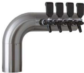
Zapfsäule »Mr.L«, 4-leitig