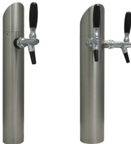
Zapfsäule „TOWER“, Edelstahl matt gebürstet