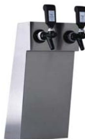
Zapfsäule »WIEN«, Edelstahl matt, 2-leitig