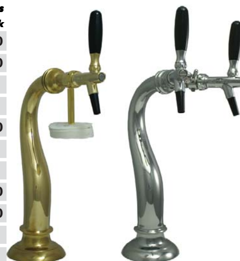
Zapfsäule „Schwanenhals“ (Lieferung ohne Tropfdeckchenhalter)