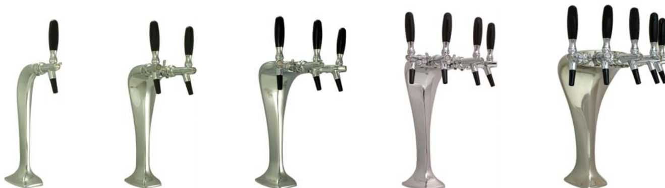
Zapfsäule »COBRA«, verchromt, 2-, 3-, 4- oder 5-leitig