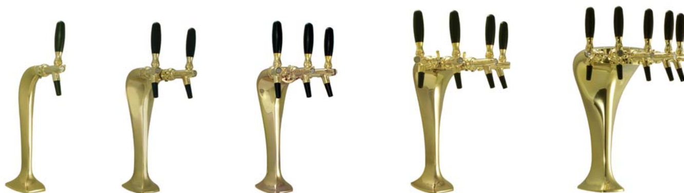
Zapfsäule »COBRA«, vergoldet, 1-,2-, 3-, 4- oder 5-leitig